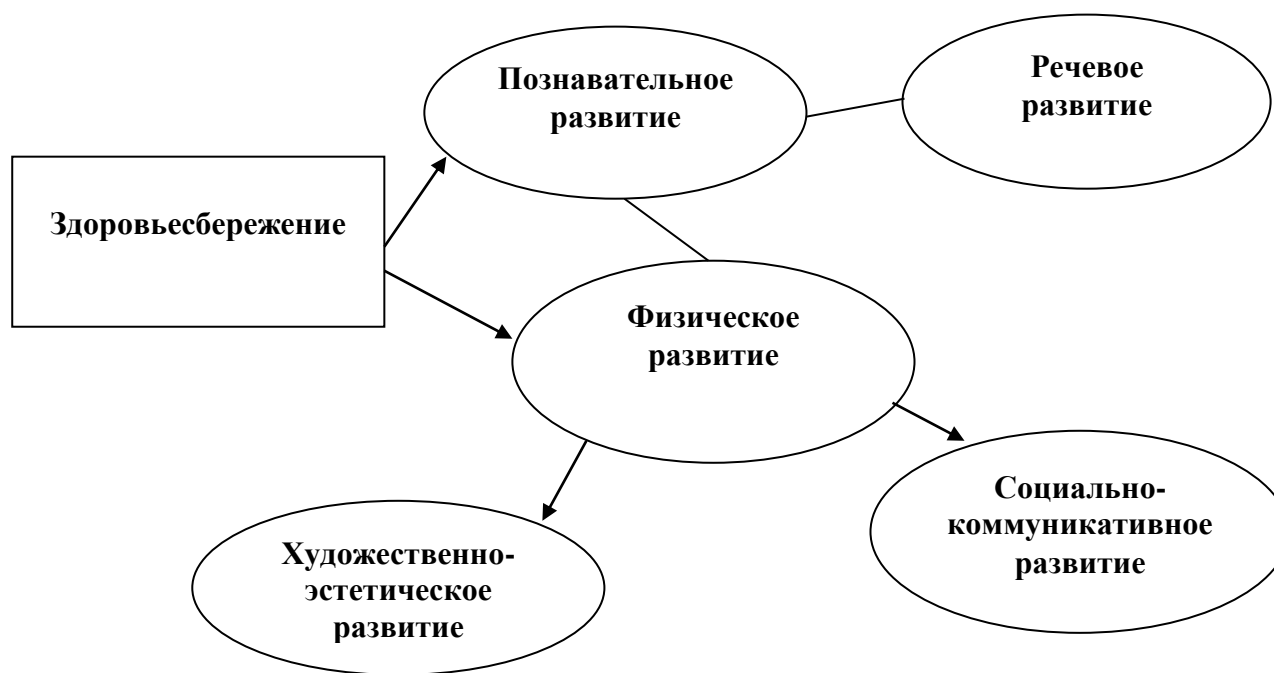
Рис.1 Особенности интеграции образовательных областей в группах оздоровительной направленности

Особенности интеграции образовательных областей в данных группах представлена на рис. 1